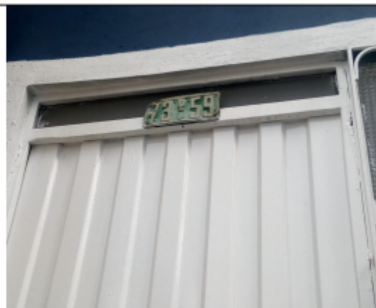
FOTOGRAFÍA N°.2 NOMENCLATURA DEL PREDIO