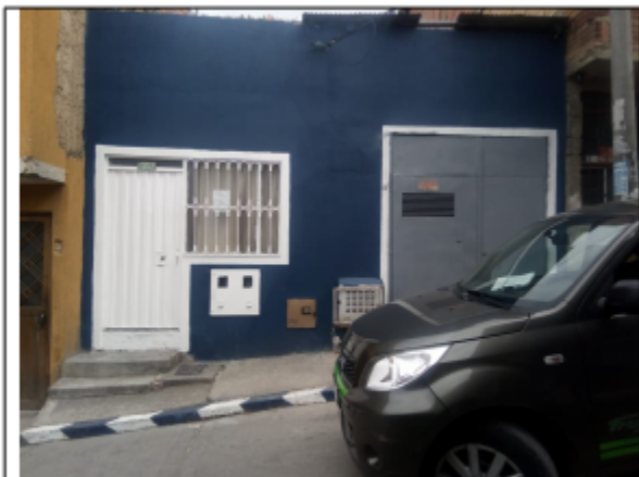
FOTOGRAFÍA N°.1 FACHADA DEL PREDIO.