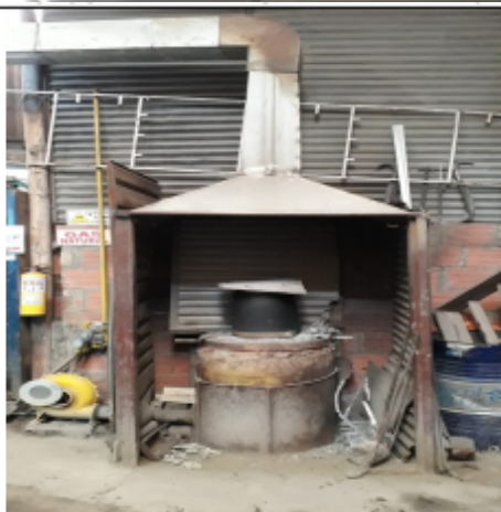
FOTOGRAFÍA N°.3 HORNO PARA FUNDICIÓN DE ALUMINIO